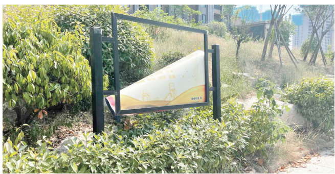
5月24日,薛城区黄河路与民生路交会路口东侧一宣传栏破损,近一半广告布脱落。

受春光的同时,也要注意文明出行,特别是携带宠物外出时,一定要牵好绳子,避免宠物伤人或者走失;同时也要注意清理垃圾和宠物粪便,保持环境整洁。王女士表示,希望相关部门加强对草坪的管理和维护,确保草坪的整洁度和卫生状况。同时,她也希望市民们能够积极参与文明城市创建,共同营造一个美丽、宜居的城市环境。