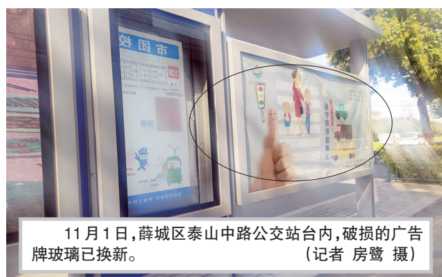
11月1日, 薛城区泰山中路公交站台内, 破损的广告牌玻璃已换新。