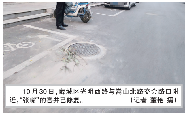
10月30日, 薛城区光明西路与嵩山北路交会路口附近, “张嘴”的窨井已修复。