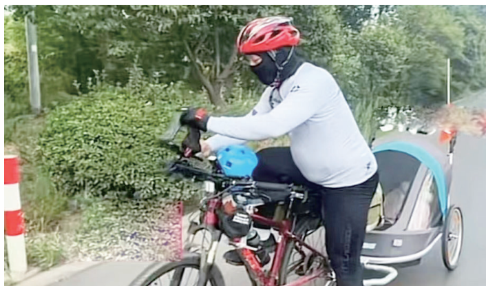
日前，枣庄一“奶爸”带着5岁女儿骑行去西藏。