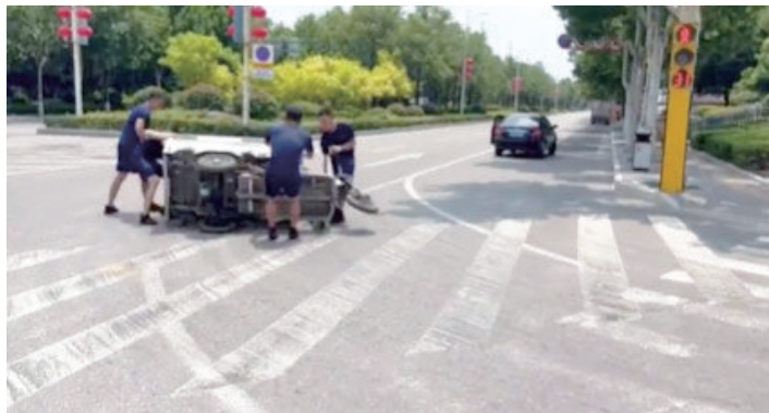
近日，消防员归队途中遇电动三轮车侧翻，及时救助，并将受伤市民送往医院。