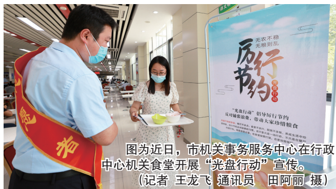
图为近日，市机关事务服务中心在行政中心机关食堂开展“光盘行动”宣传。

近年来，枣庄市认真贯彻落实国家、省、市各项反食品浪费工作安排，通过开展节约型机关创建等活动，在全市公共机构迅速掀起反食品浪费宣传热潮，各级公共机构提高了勤俭节约反对浪费意识。在近日对全市公共机构的检查过程中，党政机关食堂在餐前、餐中、餐后充分体现了节俭意识，按量取餐的显著标识促进了就餐人员的潜意识节俭，食堂垃圾清运台账显示清运量总体较上年下降24%，广大党政机关工作人员反食品浪费意识得到大幅提升。