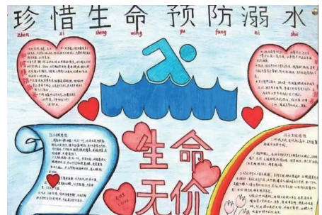
《珍惜生命 预防溺水》