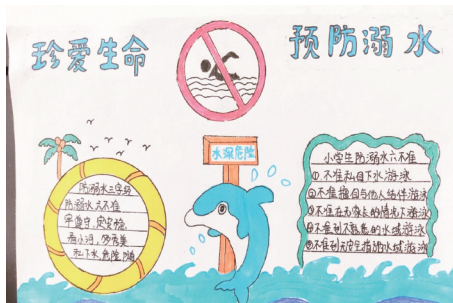
《珍爱生命 预防溺水》