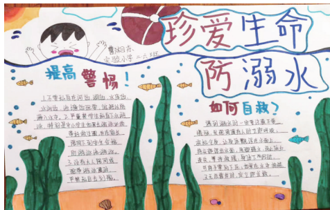
《珍爱生命 预防溺水》