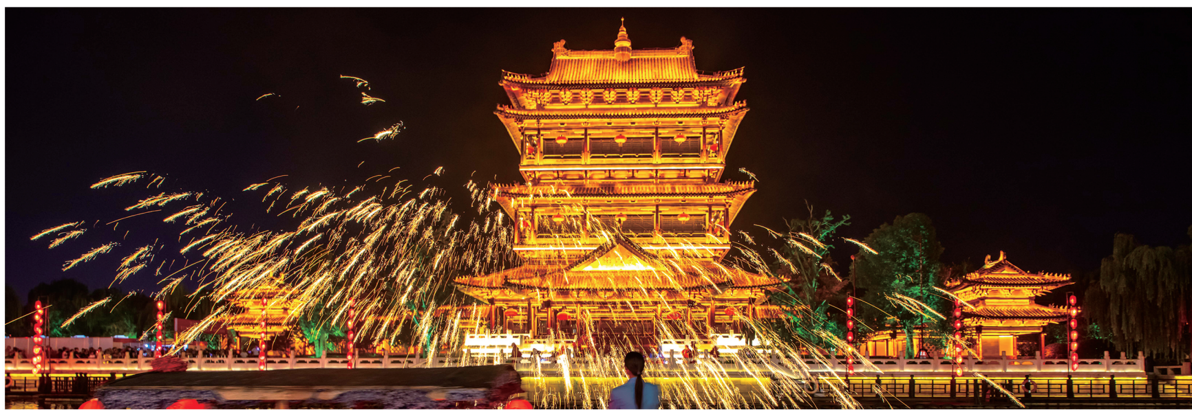
台儿庄古城复兴楼广场打铁花民俗表演(资料图)