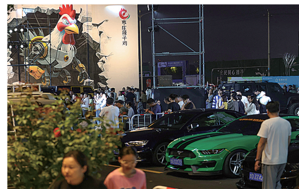
市中区辣子鸡产业园(资料图)