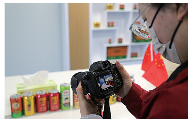
探访峰城王老吉产业园美果来展厅