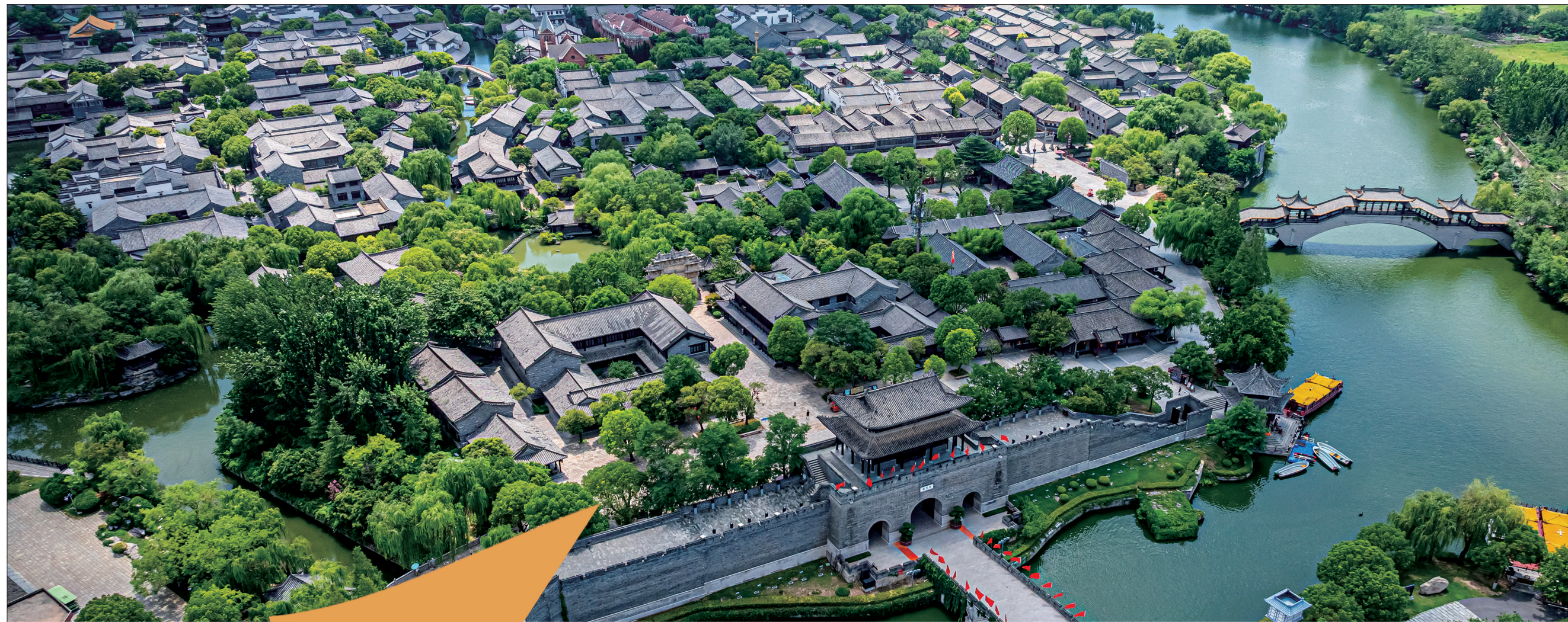
台儿庄古城鸟瞰图(资料图)