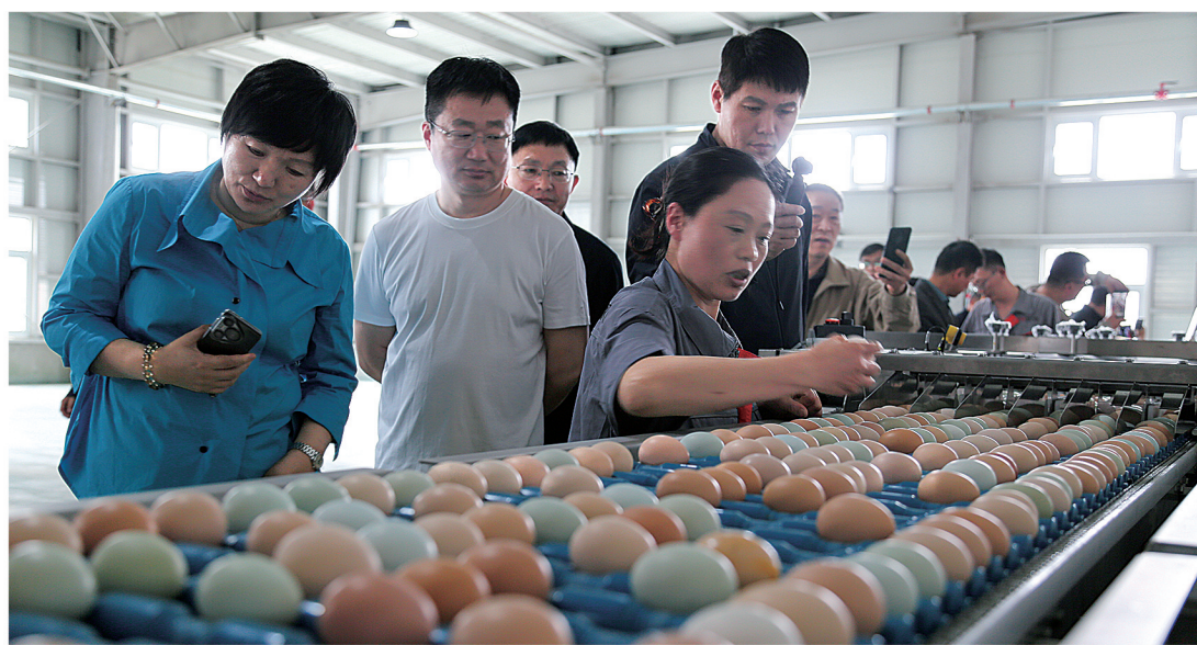
观摩孙枝鸡原种养殖场鲜蛋生产线