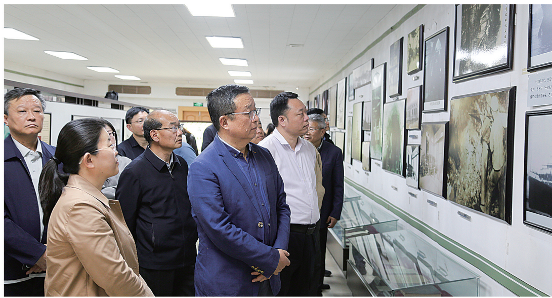
参观新中兴公司博物馆