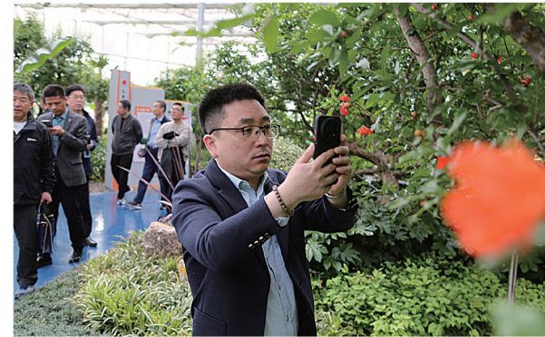
考察峰城石榴盆景精品种植园