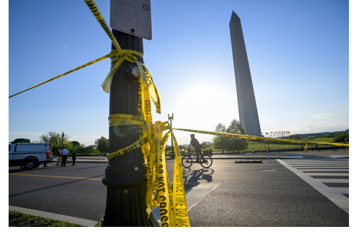
5月4日，在美国首都华盛顿，警察封锁发生枪击事件的华盛顿纪念碑附近街道。

此次国际防务与航空航天工业展览会5日开幕，为期5天，聚焦人工智能、无人作战系统及机器人平台等新一代军事技术，吸引来自120多个国家的1700余家参展商。