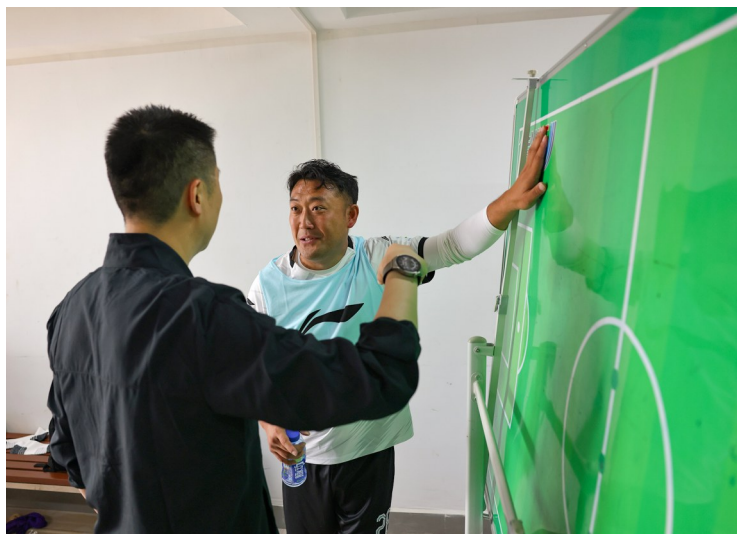
枣庄丰源轮胎足球队队长在中场时分析局势

胜负从来都不是绿茵场的唯一答案。这场以球为媒的相遇,既是两座鲁南兄弟城市的体育对话,更是山东足球向上生长的生动注脚。菏泽“武术+足球”的特色探索,枣庄坚韧不拔的赛场风骨,都在今天的绿茵场上绽放了属于自己的光芒。