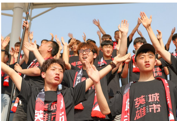
枣庄的铁杆球迷也远赴菏泽为枣庄丰源轮胎足球队加油