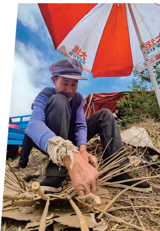
现编的柳条筐还是受到很多人的青睐