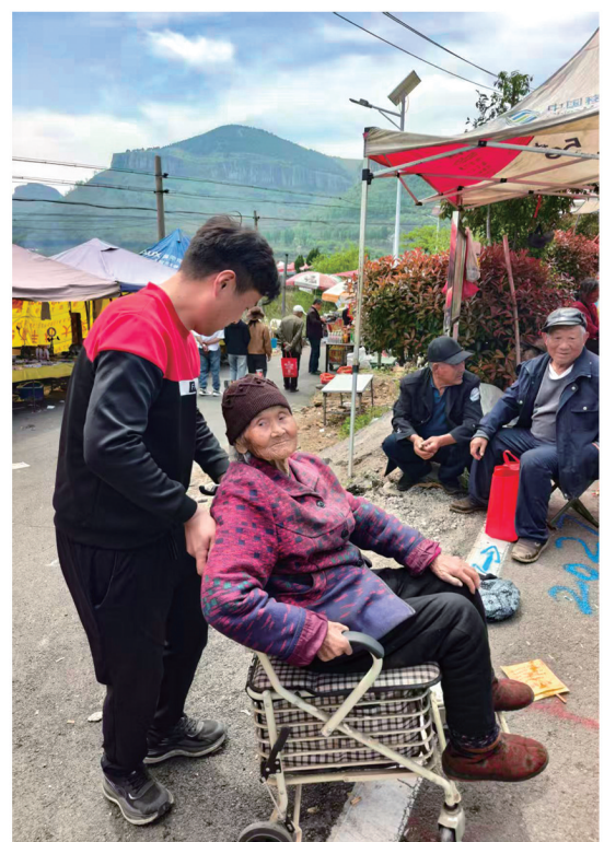
“春暖花开，我也来瞅瞅。”