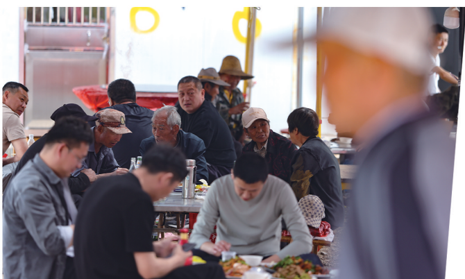
逛完庙会来喝个羊肉汤是标配