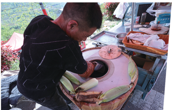
现场制作的梅干菜肉饼香迷糊了