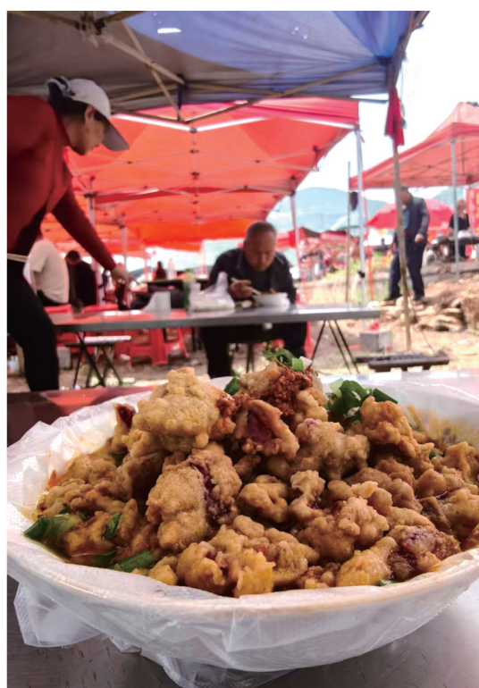
利民大集的丸子汤也来赶庙会了