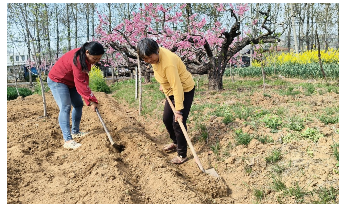
4月6日，台儿庄区张山子镇山南头村，田间地头一派热火朝天的劳作景象。当地农户抢抓春季黄金农时，开展种植作业，播种丰收的希望。

“我们将以开展树立和践行正确政绩观学习教育为契机，强化重点领域和关键环节监管，规范医疗服务行为，让清廉之风浸润医院，用廉洁行医守护民生，着力营造干事创业、崇廉尚实、风清气正的良好氛围。”该院纪委书记王伟表示。（宋伟 周子洋）