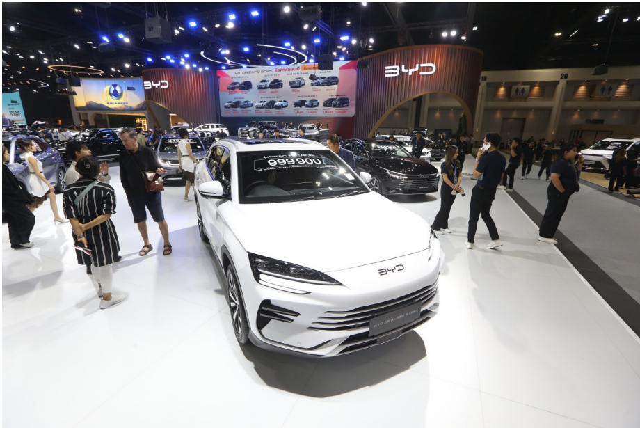
在泰国首都曼谷举行的泰国国际车展上，人们参观比亚迪展台（2025年12月2日摄）。