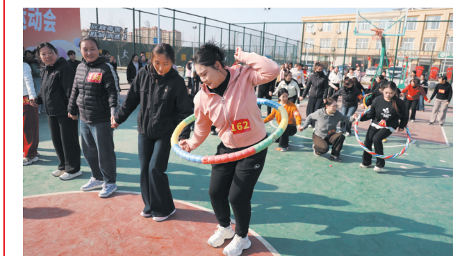
3月6日，山亭区举行“逐梦巾帼路 运动绽芳华”女职工趣味运动会，来自该区各单位的女职工们齐聚一堂，在欢笑中庆祝“三八”国际劳动妇女节。