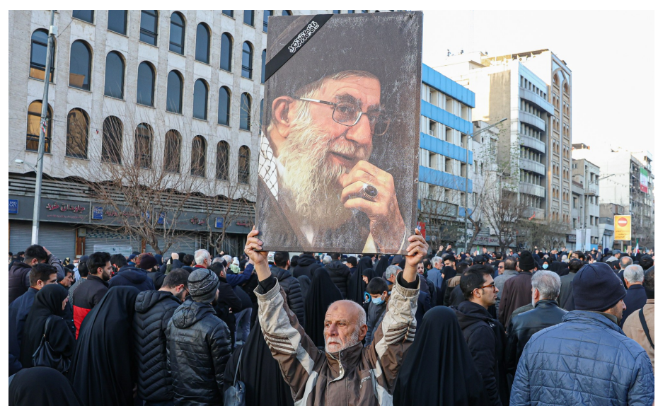
3月1日，民众在伊朗首都德黑兰集会，哀悼伊朗最高领袖哈梅内伊。

新华社北京3月1日电 综合新华社驻外记者报道：3月1日，美国和以色列对伊朗的军事打击进入第二天。伊朗多家媒体当天证实，伊朗最高领袖哈梅内伊遇害，引发国际社会强烈震动。针对美国和以色列持续打击，伊朗展开大规模反击。目前，战事已延烧至整个波斯湾，中东局势有可能被推向危险的深渊。