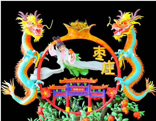
2024年1月14日，面塑作品《榴园闹春》