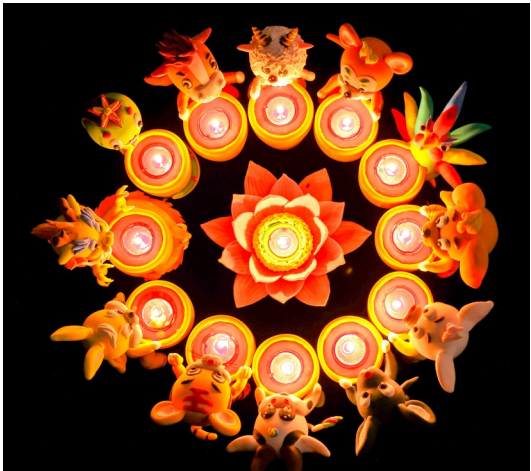
2023年2月4日，点亮“十二生肖”面灯