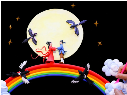
2025年8月29日，创作面塑作品《鹊桥会》