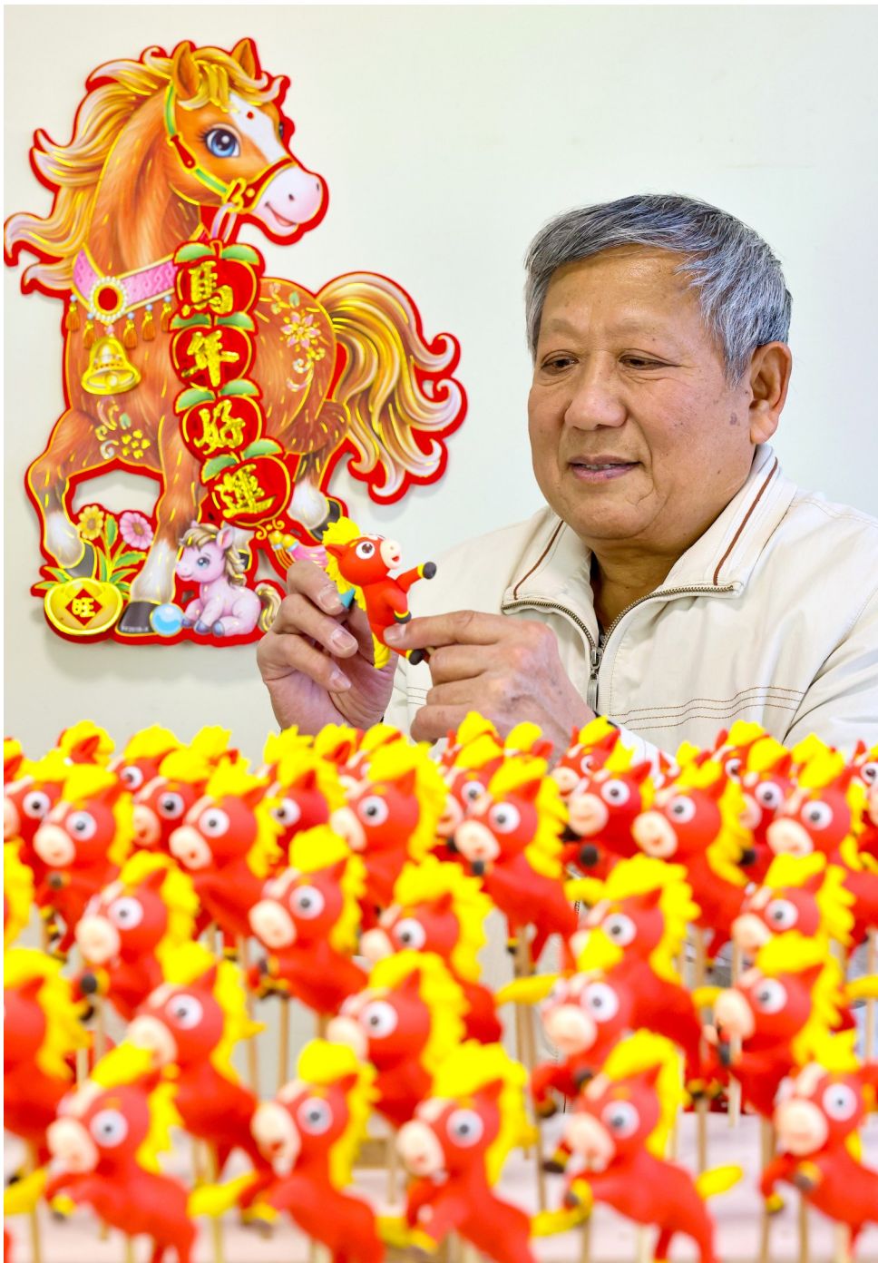
2026年2月8日，创作面塑作品《“百马”闹春》