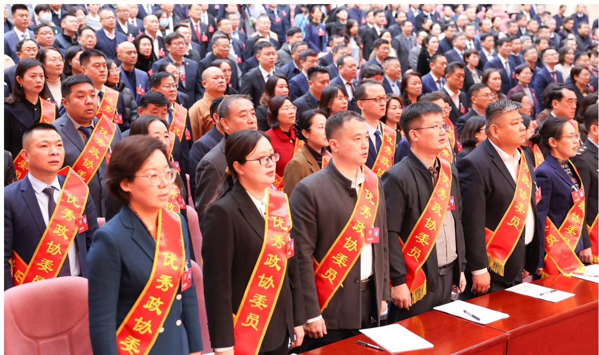
优秀政协委员披上了红色的绶带