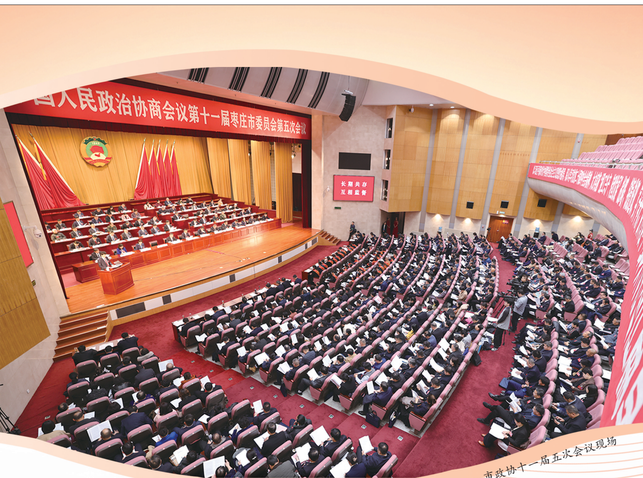
市政协十一届五次会议现场