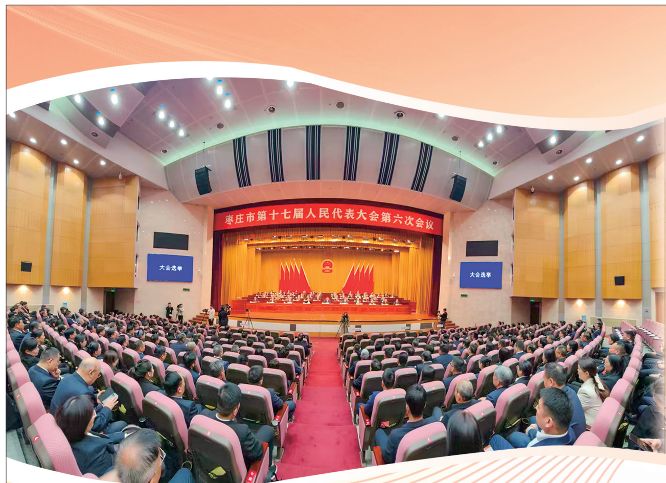
市十七届人大六次会议现场