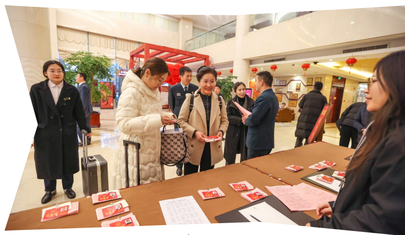
人大代表们向大会报到

稳中求进工作总基调，坚定扛牢“走在前、挑大梁”使命担当，积极融入全省绿色低碳高质量发展先行区建设，锚定“资源型城市绿色低碳转型发展引领市”总体发展定位，大力实施“强工兴产、转型发展”战略，创新开展“十大行动”，以经济建设为中心，以推动高质量发展为主题，以改革创新为根本动力，以满足人民日益增长的美好生活需要为根本目的，更好统筹发展和安全，稳扎稳打、踏踏实实，集中力量打造新能源产业基地、大运河文化旅游名城，奋力谱写现代化强市建设的崭新篇章。