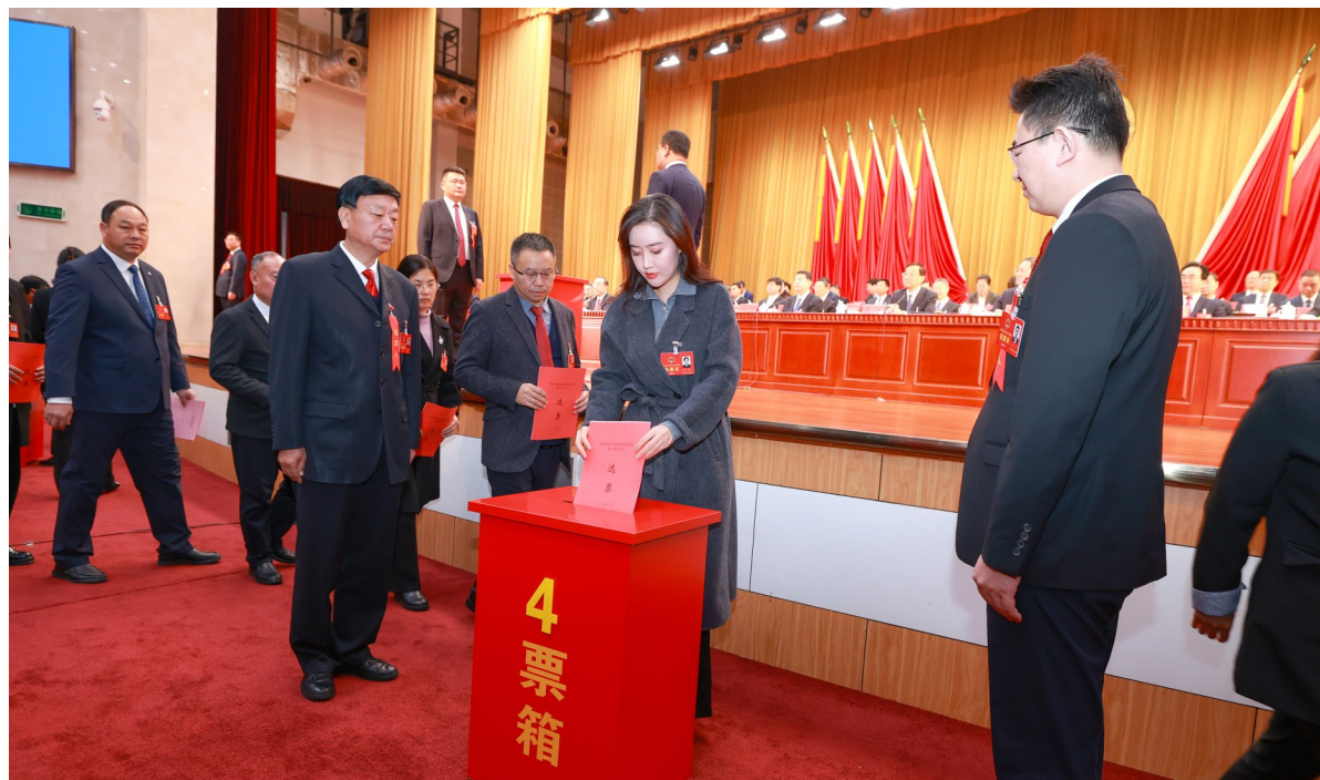
人大代表们投下庄严的一票