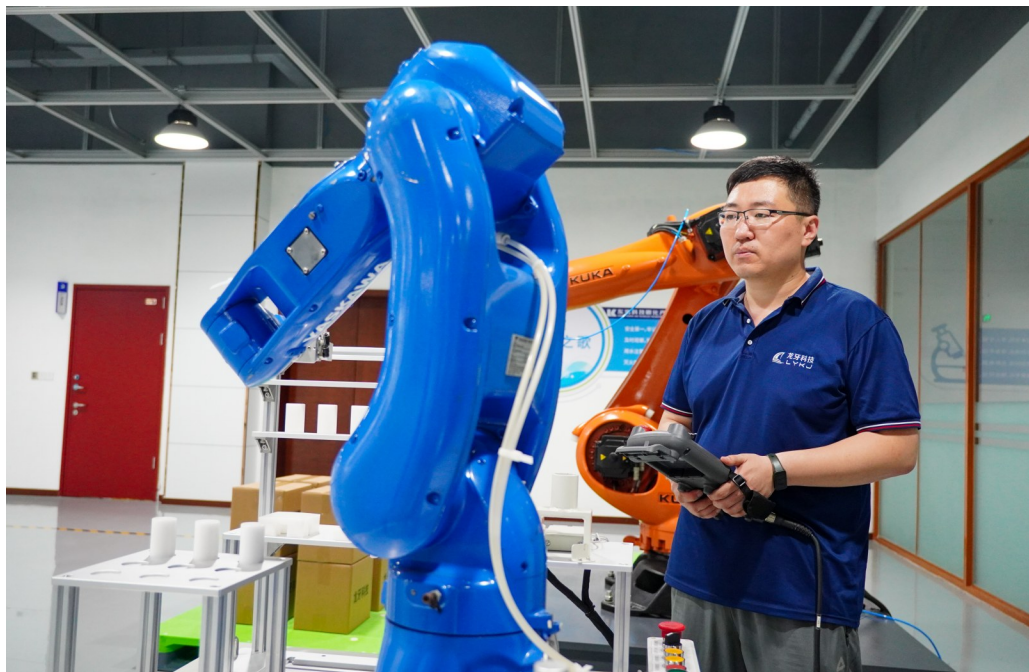
在位于龙口市的龙牙智能生产车间里，工作人员在检测一台工业机器人（7月2日摄）。

中小企业培育库，对企业进行梯度培育。龙口市科技局局长代腾飞说：“我们将引导企业加强重点实验室、技术创新中心等创新平台建设，构建创新企业梯队格局。”