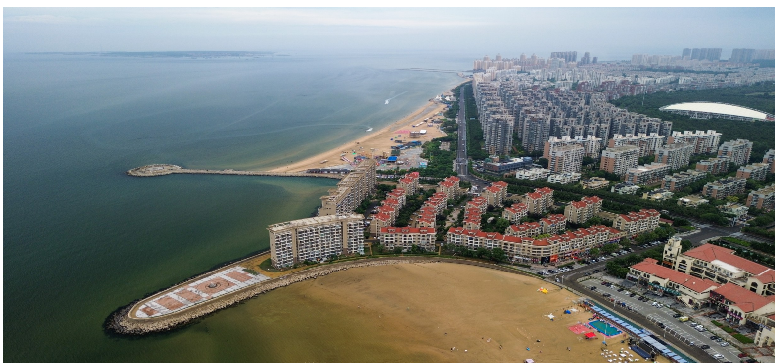
这是龙口市海滨城区（7月2日摄，无人机照片）。