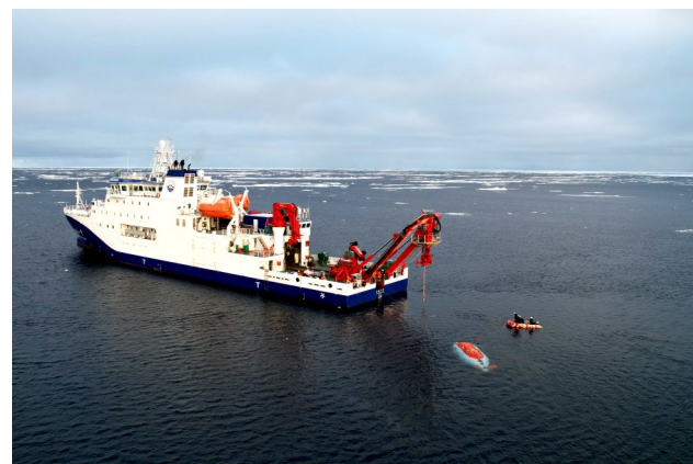
2025年8月11日，“蛟龙”号在北极冰区下潜归来。