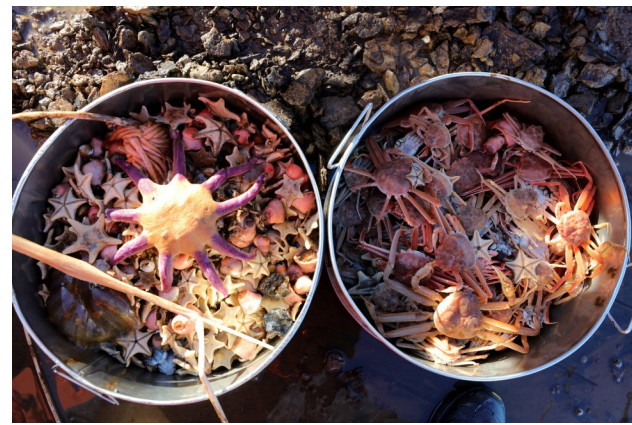
2025年9月10日拍摄的考察队获取的部分底栖生物样品。