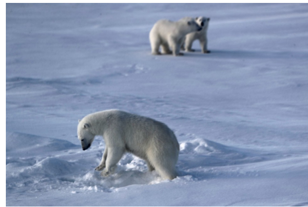
2025年8月31日在北冰洋高纬度地区拍摄的北极熊一家三口。

张北辰说，中国北极科考不断加强对于北极地区海—冰—气相互作用的研究，促进应对北极气候变化的国际合作，稳步增强认识北极、保护北极和利用北极的能力，从而更好地应对北极环境和气候变化带来的挑战。（新华社北京11月13日电）