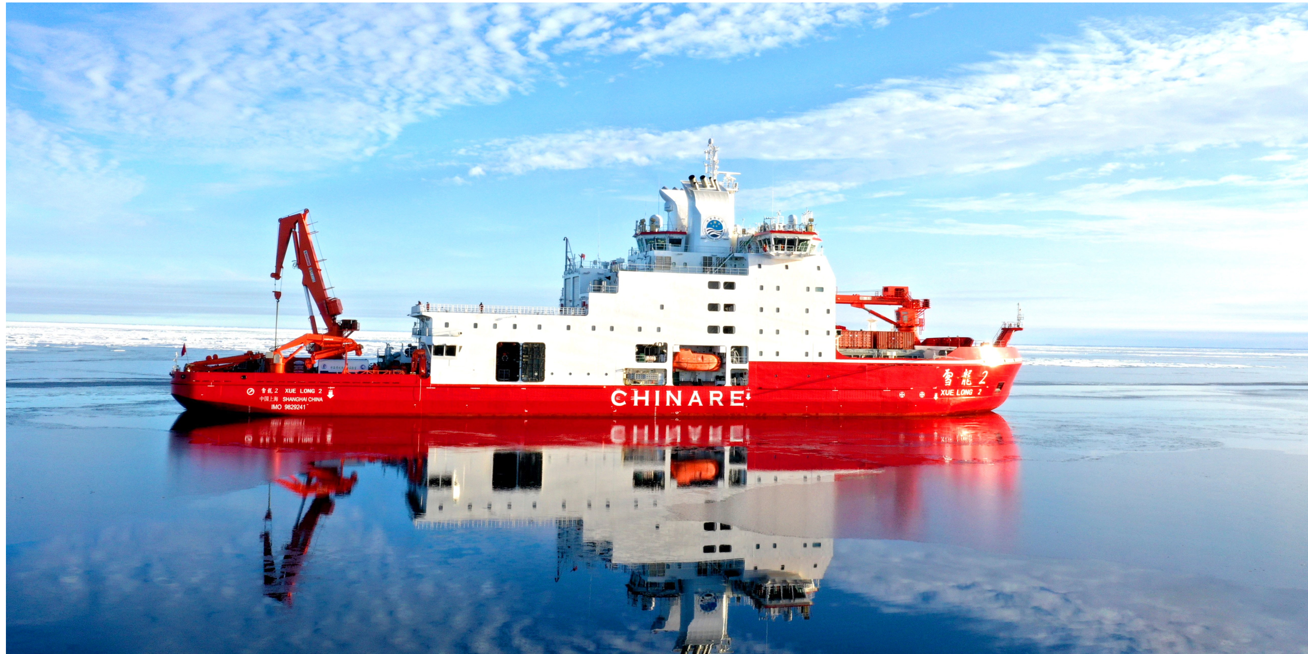
2025年7月24日，“雪龙2”号极地科考破冰船在北冰洋科考（无人机照片）。