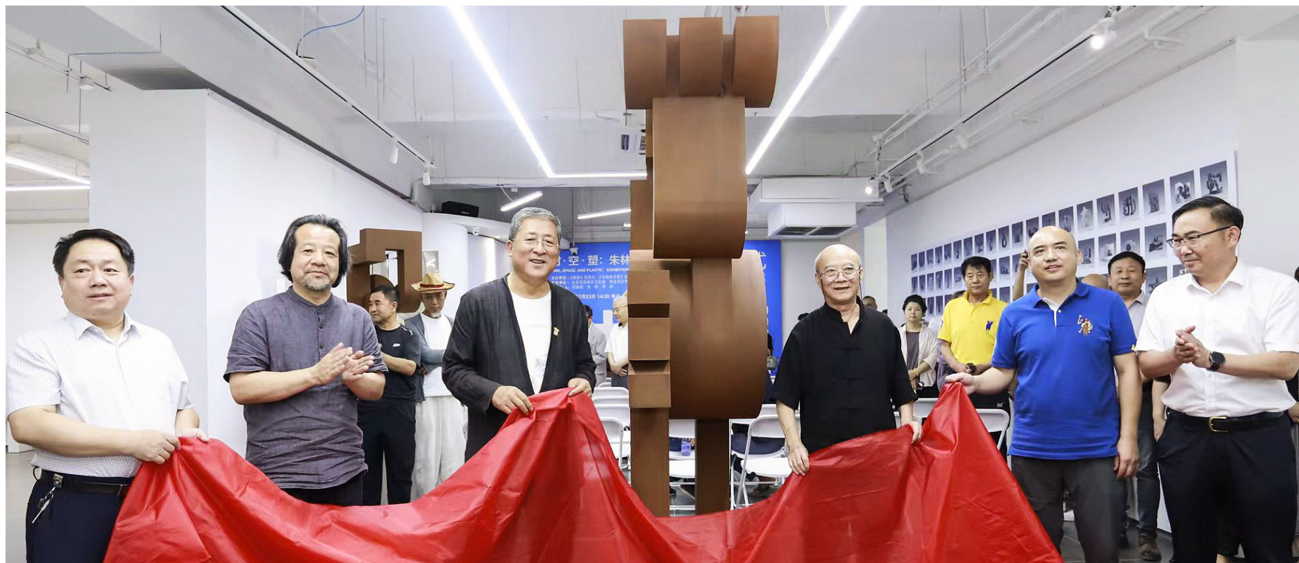
7月23日，社会各界人士在《中国美术报》艺术中心共同为《立春》作品揭幕