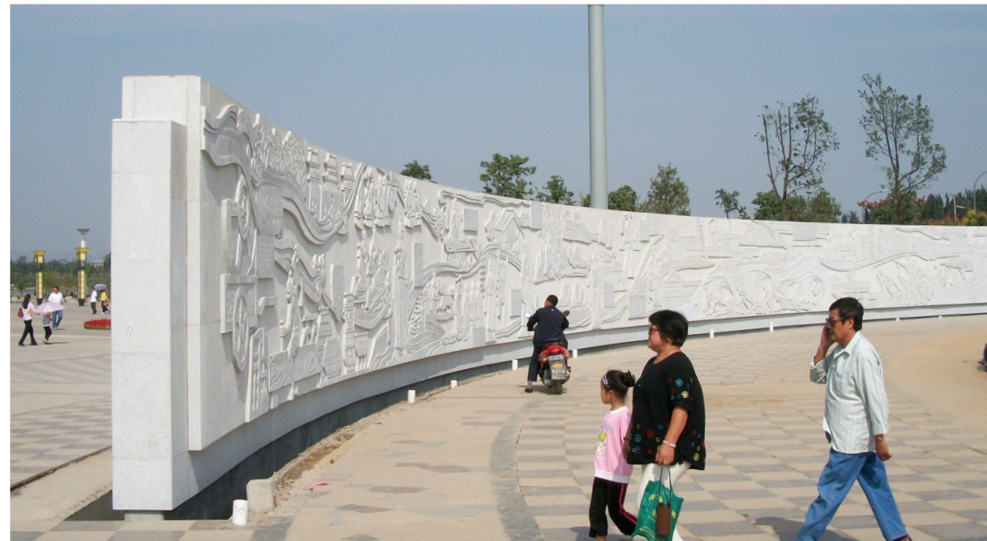
市中区东湖公园浮雕《历史长河》