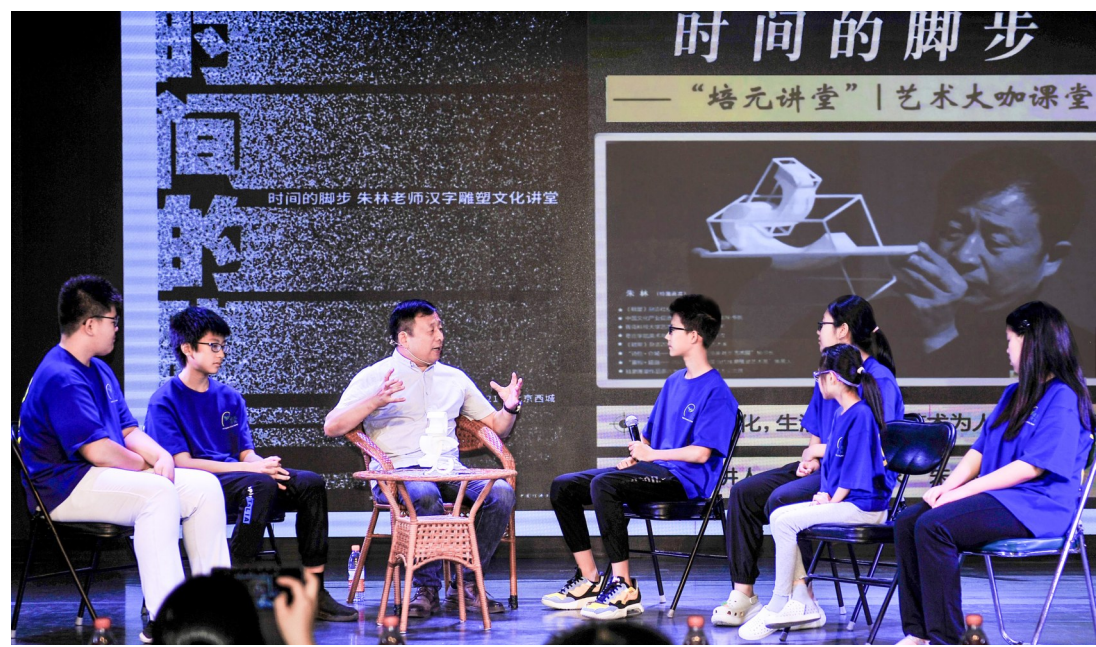
做客文化讲堂与学生互动