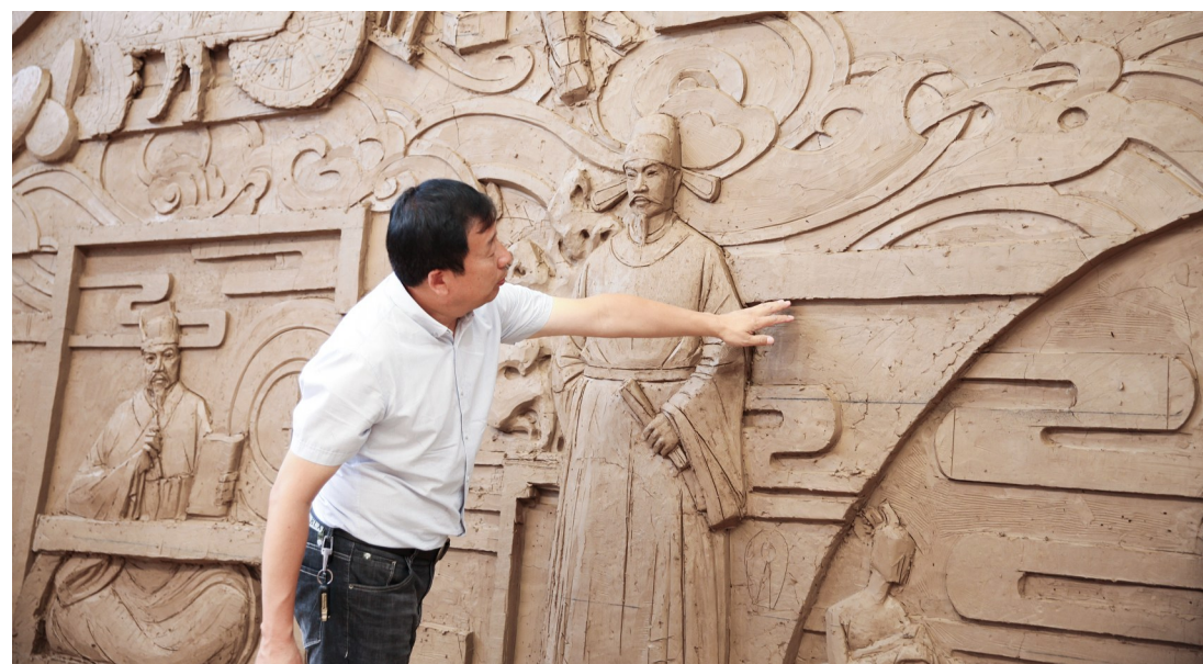
枣庄城市规划馆《人杰地灵》雕塑泥稿