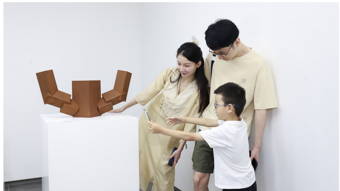
年轻观众“打卡”文字雕塑