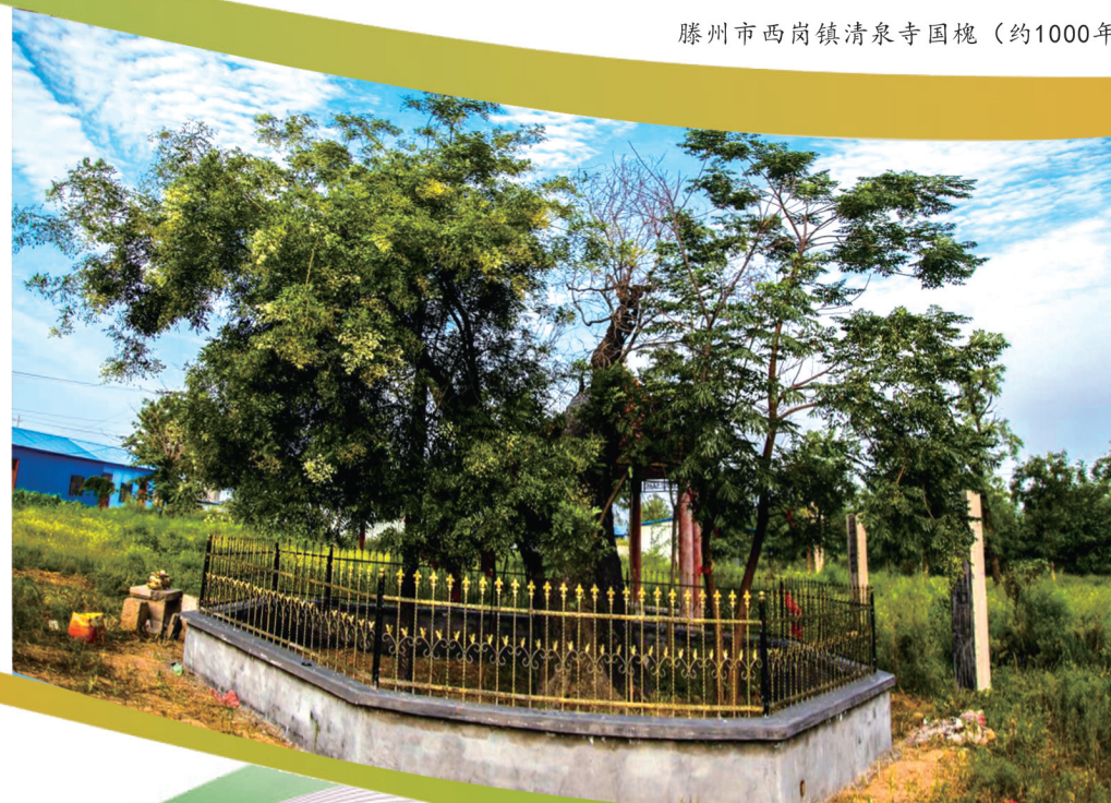
滕州市西岗镇清泉寺国槐（约1000年）