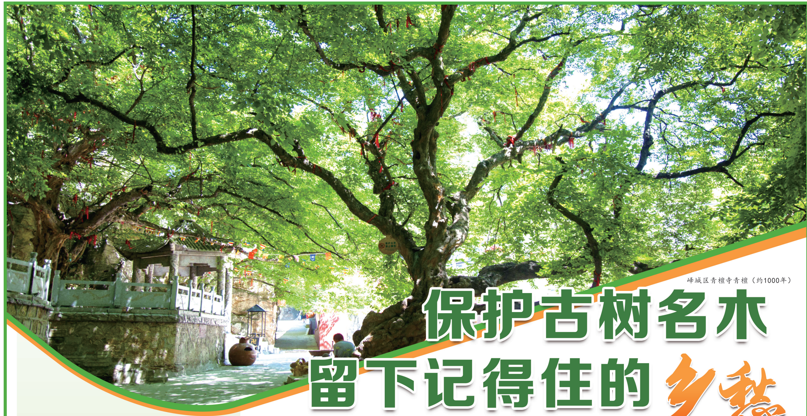
峰城区青檀寺青檀（约1000年）