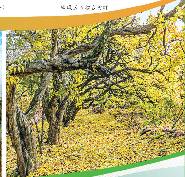
峰城区石榴古树群