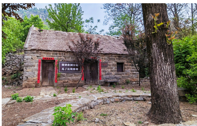
抗战时期粮坊旧址