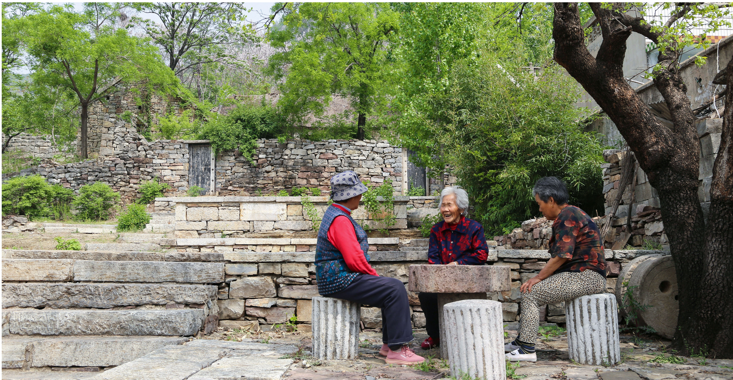
古村里的老人在休闲