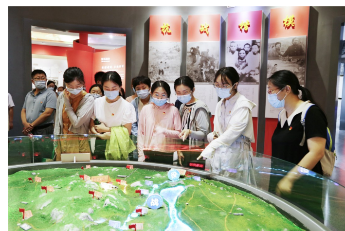
抗日纪念馆成为革命教育基地