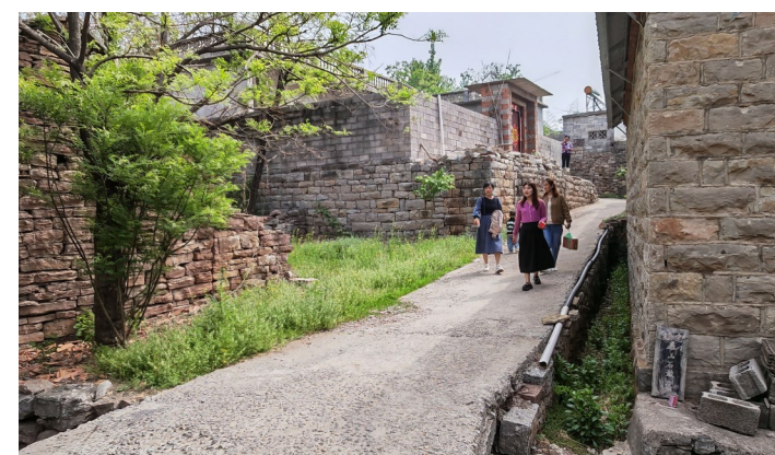
古村庄吸引游客来观光

容村貌整体提升，旅游线路规划，村中道路环境综合整治等，加快了传统村落基础设施改造升级和配套完善公共服务设施。同时，乡村的柳编、剪纸、布艺等非遗项目传承人各显神通；林果、楸花、连翘加工等成为当地特色旅游产品，特色餐饮等也给农民带来增收；闲置小院复活，搜集保存老家具、农具等传统文化象征符号，将文化底蕴深厚的鲁南民居整合成游客体验乡村文化的载体，增加农民致富途径。如今，这个传统的村落在乡村振兴中正焕发着新的生机和活力。